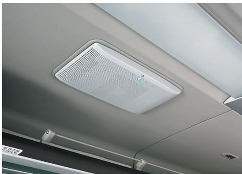
●プラズマクラスターイオン発生装置